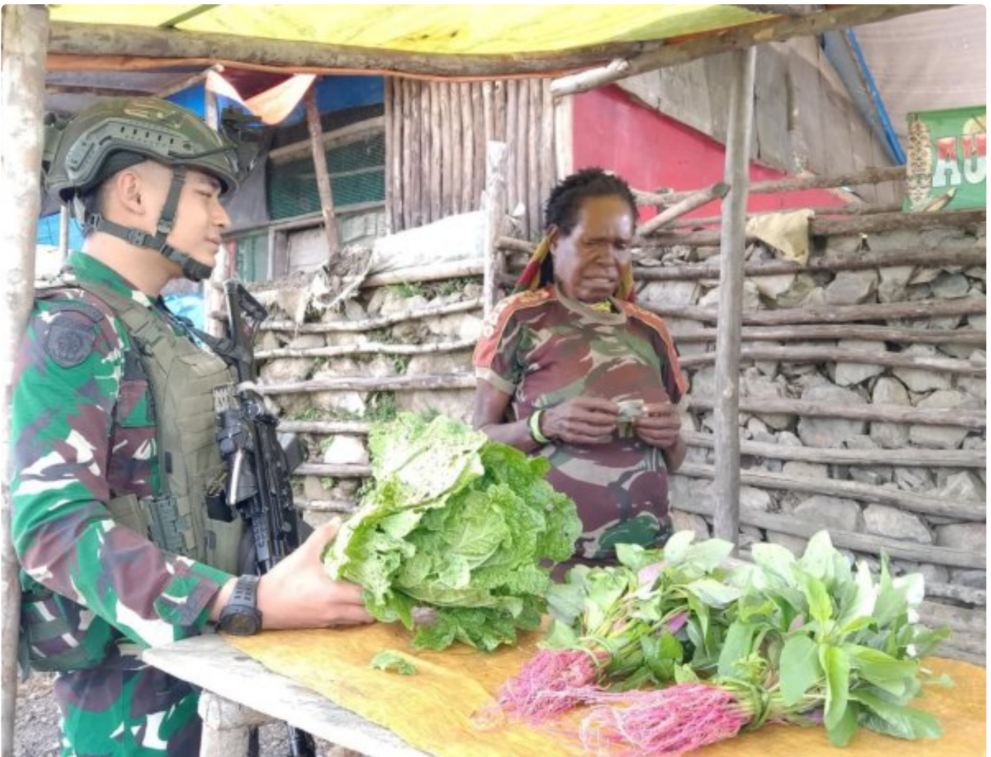
Prajurit TK Pintu Jawa Satgas Mobile Yonif 323/Buaya Putih Memborong hasil Tani mama Papua yang dijual di TK Pintu Jawa

Satgas Pantas Mobile Yonif 323 Buaya Putih Kostrad TK Pintu Jawa melaksanakan kegiatan ROSITA, kegiatan ini bertujuan untuk membeli hasil tani dari Mama-mama Papua yang datang ke TK Pintu Jawa sebagai wujud saling membutuhkan dan mendukung perekonomian warga setempat, yang